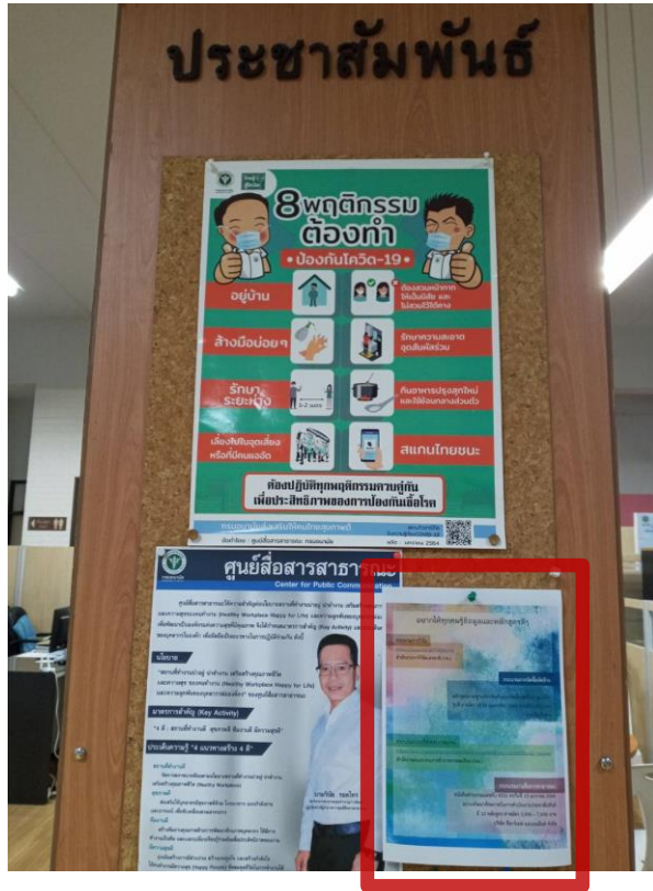
ครั้งที่ 1