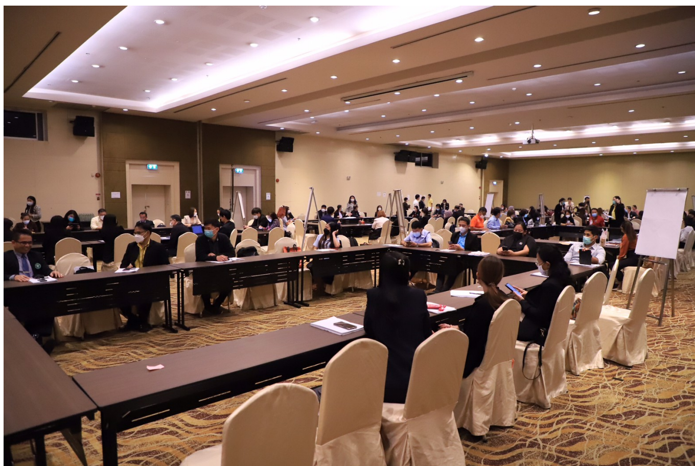
รอบที่ 1 : 5 เดือนแรก (ตุลาคม 2565 – กุมภาพันธ์ 2566) กองส่งเสริมความรู้และสื่อสารสุขภาพ